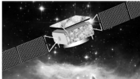
图 1.1 图标题